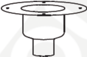
Boîtier avec collerette